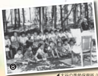
◀大谷の季節保育所(昭和37年)

市長 そうだね。親せきや近所の農作業を手伝いに行くのも 普通のことだったし、近所中が顔見知りで、地域社会のつな がりの強い時代でしたね。