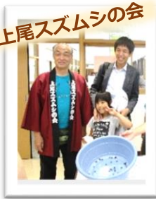
▲スズムシに大喜び!!