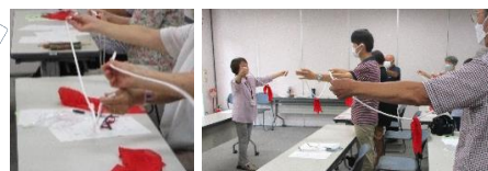
▲ロープに苦戦しながらも見事に成功