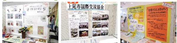
▲工夫を凝らした展示に多くの人が見入っていました ▲竹を火であぶって曲げます