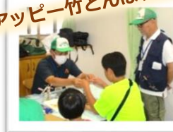
アップー竹とんぼクラブ