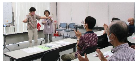
▲実演する様子。気分はマジシャン!!