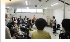
▲来場者を前に朗読を披露