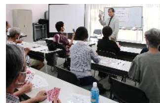
▲真剣なまなざしの参加者